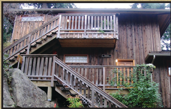
Maison Hastings. Salt Spring Island, BC, Canada

Ce produit écologique et non toxique est très apprécié des consommateurs et des entrepreneurs qui ne veulent nuire d'aucune façon à la qualité de l'environnement.